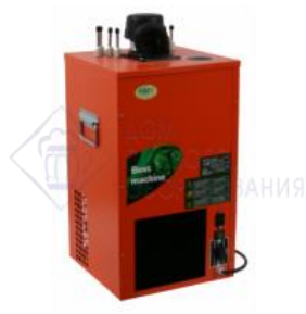
Охладитель на 4 пр. 70 л./час, 1/4 л.с."Nord"