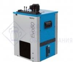
Охладитель на 4 пр. 50 л./час, 1/3 л.с. "EVO 50". Cornelius