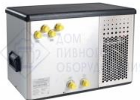
Охладитель на 4 пр. 50 л./час, 1/3 л.с. "ECOFLO H50". Cornelius