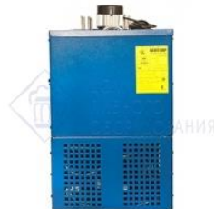
Охладитель на 4 пр. 150 л./час, 2/3 л.с. "Дюк". "ДПО"