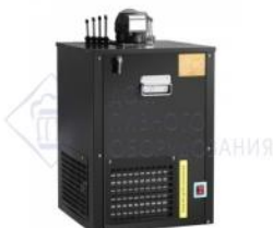
Охладитель на 4 пр. 80 л./час, 1/3 л.с. "Siberia-80". -