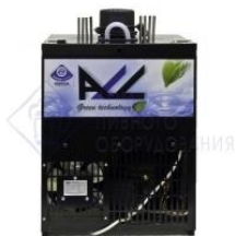
Охладитель на 4 пр. 100 л./час, 1/3 л.с. "BR-S"