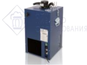
Охладитель на 4 пр. 70 л./час, 1/4 л.с. "JET 30". Италия