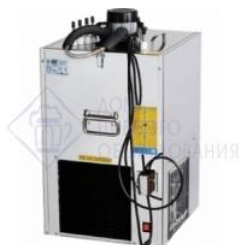
Охладитель на 4 пр. 90 л./час, 1/3 л.с. "Тайфун- 90". Украина