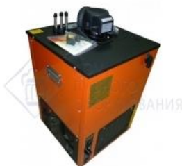
Охладитель на 4 пр. 70 л./час. 1/4 л.с. Ванна 30 л. "Siberia-70". Оранжевый -