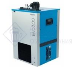
Охладитель на 4 пр. 100 л./час, 2/5 л.с. "EVO 100". Cornelius