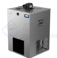
Охладитель на 4 пр. 70 л./час, 1/4 л.с. "DBC 25/35". GAMKO