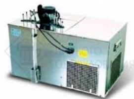
Охладитель на 4 пр. 120 л./час, 1/3 л.с. "Тайфун-120В" (вертикальный). Украина

Архангельск (8182)63-90-72 Иваново (4932)77-34-06 Магнитогорск (3519)55-03-13 Пермь (342)205-81-47 Сургут (3462)77-98-35 Астана (7172)727-132 Ижевск (3412)26-03-58 Москва (495)268-04-70 Ростов-на-Дону (863)308-18-15 Тверь (4822)63-31-35 Астрахань (8512)99-46-04 Казань (843)206-01-48 Мурманск (8152)59-64-93 Рязань (4912)46-61-64 Томск (3822)98-41-53 Барнаул (3852)73-04-60 Калининград (4012)72-03-81 Набережные Челны (8552)20-53-41 Самара (846)206-03-16 Тула (4872)74-02-29 Белгород (4722)40-23-64 Калуга (4842)92-23-67 Нижний Новгород (831)429-08-12 Санкт-Петербург (812)309-46-40 Тюмень (3452)66-21-18 Брянск (4832)59-03-52 Кемерово (3842)65-04-62 Новокузнецк (3843)20-46-81 Саратов (845)249-38-78 Ульяновск (8422)24-23-59 Владивосток (423)249-28-31 Киров (8332)68-02-04 Новосибирск (383)227-86-73 Севастополь (8692)22-31-93 Уфа (347)229-48-12 Волгоград (844)278-03-48 Краснодар (861)203-40-90 Омск (3812)21-46-40 Симферополь (3652)67-13-56 Хабаровск (4212)92-98-04 Вологда (8172)26-41-59 Красноярск (391)204-63-61 Орел (4862)44-53-42 Смоленск (4812)29-41-54 Челябинск (351)202-03-61 Воронеж (473)204-51-73 Курск (4712)77-13-04 Оренбург (3532)37-68-04 Сочи (862)225-72-31 Череповец (8202)49-02-64 Екатеринбург (343)384-55-89 Липецк (4742)52-20-81 Пенза (8412)22-31-16 Ставрополь (8652)20-65-13 Ярославль (4852)69-52-93