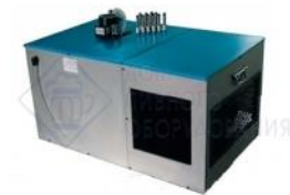
Охладитель на 12 пр. 200 л./час, 3/4 л.с. "EVO 200". Cornelius