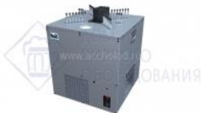
Охладитель на 12 пр. 210 л./час, 1 л.с. "BR-XXL"