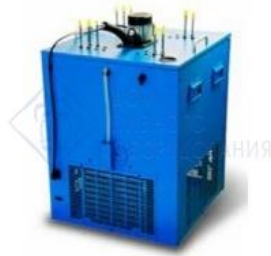
Охладитель на 12 пр. 220 л./час, 3/8 л.с. "Тайфун-220". Украина