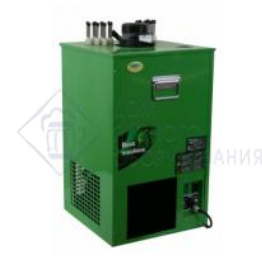
Охладитель на 12 пр. 170 л./час, 1/2 л.с. "Nord"