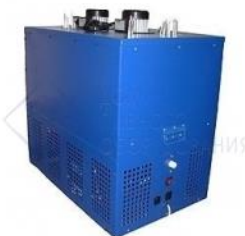
Охладитель на 12 пр. 250 л./час, 1,25 л.с. "Монстр". "ДПО"