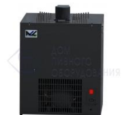
Охладитель на 12 пр. 160 л./час, 3/4 л.с. "BR-XL"