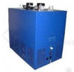
Охладитель на 12 пр. 220 л./час, 1 л.с. "МАХ". "ДПО"

Сухие пивоохладители. Устройства этого типа имеют иной принцип работы. Вода в них не используется. Вместо этого имеется алюминиевый блок, в котором находятся змеевики. Охлаждение также производится фреоном, но через стенки блока.