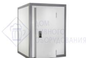
Холодильная камера Standart 11,75м 3 КХН-11,75. 2560X2560X2200 Полаир

Архангельск (8182)63-90-72 Астана (7172)727-132 Астрахань (8512)99-46-04 Барнаул (3852)73-04-60 Белгород (4722)40-23-64 Брянск (4832)59-03-52 Владивосток (423)249-28-31 Волгоград (844)278-03-48 Вологда (8172)26-41-59 Воронеж (473)204-51-73 Екатеринбург (343)384-55-89