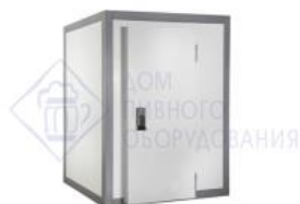
Холодильная камера Standart 6,61м 3 КХН-6,61. 1960X1960X2200 Полаир