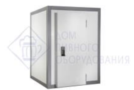
Холодильная камера Standart 11,02м 3 КХН-11,02. 3160X1960X2200 Полаир