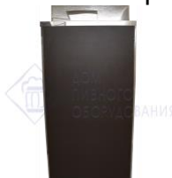
Кегератор-шкаф (холодильная камера) на 8 кег по 50л. "Эконом" комплектация №1