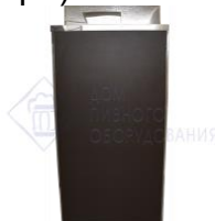
Кегератор-шкаф (холодильная камера) на 8 кег по 50л. "Эконом" комплектация №2