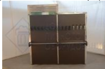
Кегератор-шкаф (холодильная камера) на 16 кег