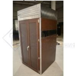
Кегератор-шкаф (холодильная камера) на 8 кег