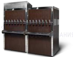
Кегератор-шкаф (холодильная камера) на 20 кег. (эконом)