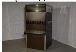
Кегератор-шкаф (холодильная камера) на 8 кег. (эконом)