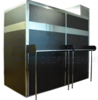
Кегератор-шкаф (холодильная камера) на 20 кег по 50л. "Бизнес" (белая рама)