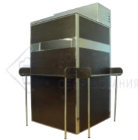
Кегератор-шкаф (холодильная камера) на 8 кег по 50л. "Бизнес" (рама-венге)