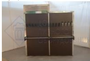
Кегератор-шкаф (холодильная камера) на 16 кег. (эконом)