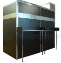
Кегератор-шкаф (холодильная камера) на 20 кег по 50л. "Бизнес" (рама-венге)