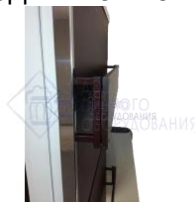
Планка для крепления пивных кранов и Пеногасителей