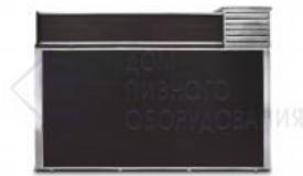
Кегератор-прилавок (холодильная камера) на 4 кеги

Важным моментом при продаже разливного пива является создание правильной температуры его хранения. Ведь в случае переохлаждения этого напитка при розливе создается излишнее давление, заставляющее его пениться и разбрызгиваться. Кроме того, не происходит правильного высвобождения углекислого газа, он остается в пиве и, попадая в организм потребителя, вызывает дискомфорт, вздутие живота, изжогу и даже порой способствует обострению ряда хронических заболеваний. В случае же перегрева углекислый газ наоборот, выделяется еще внутри кеги. Происходит избыточное пенообразование – пиво попросту превращается в пену. Это не выгодно любому продавцу, он несет убытки. Также при повышении температуры происходит ухудшение вкусовых качеств хмельного напитка. Потери в прибыли у продавца могут возникнуть и по причине того, что теплое пиво отнюдь не привлекательно для покупателей. Ну и, наконец, от тепла пиво может просто-напросто скиснуть. Вот почему так важно подобрать надежное оборудование, способствующее хранению кегов при оптимальной температуре, которой считается + 3,5 градусов.